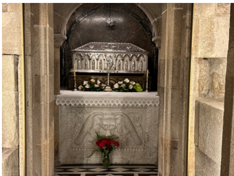
Grób św. Jakuba.