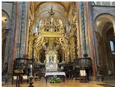
Katedra w Santiago de Compostela